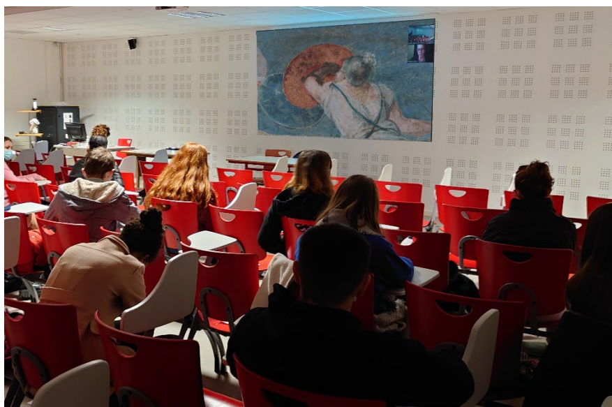
Intervention en visio-conférence

Jérôme Diacre, professeur de philosophie à la Cité Scolaire de Jean Moulin - Thouars et professeur relais pour le château d'Oiron.