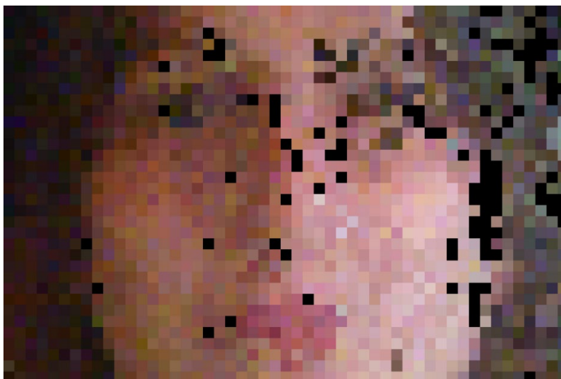
Romane © IDEHAY 2021

Du 9 février au 18 avril au château d'Oiron