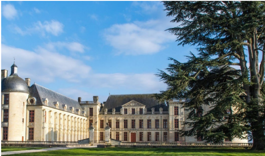
Le château d'Oiron

Le château d'Oiron a été édifié aux XVI e et XVII e siècles par la famille des Gouffier. Au XVI e siècle, Claude Gouffier est grand écuyer des rois François I er et Henri II ; il aurait inspiré à Charles Perrault, le personnage du marquis de Carabas (1697). Peu avant 1550, il fait peindre, le décor d'une galerie de 55 mètres de long, exemple exceptionnel du style de l'École de Fontainebleau, qui met en scène l'histoire de la guerre de Troie.