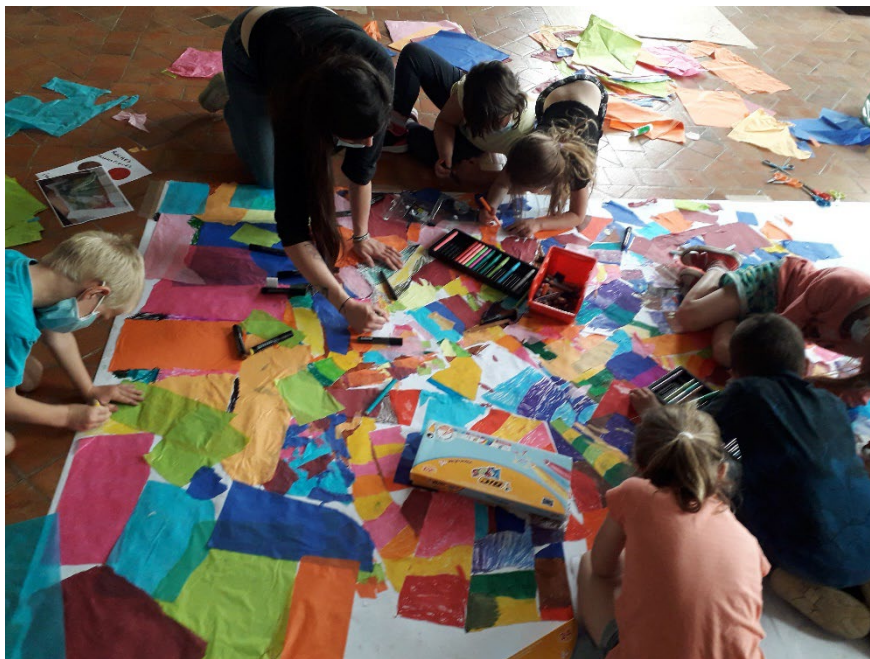
Atelier in situ