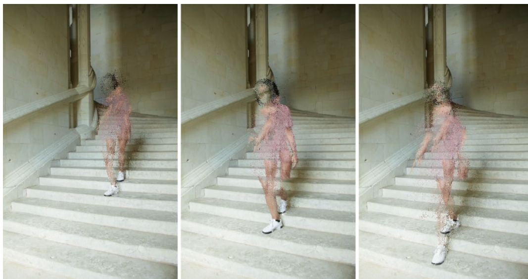
Escalier © IDEHAY 2021

À l'heure de l'intelligence artificielle et de la reconnaissance faciale, l'œuvre interroge ce qui perdure de la figure humaine dans la mémoire.