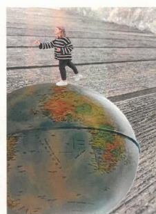
Roule roule petite planète