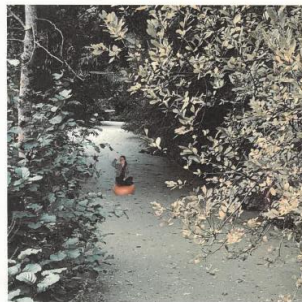
Perdue dans la marais du Galuchet