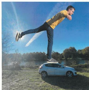
Richesse et valeur