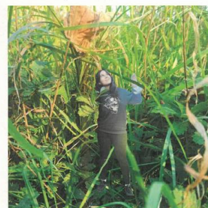
Point de vue d'une fourmi