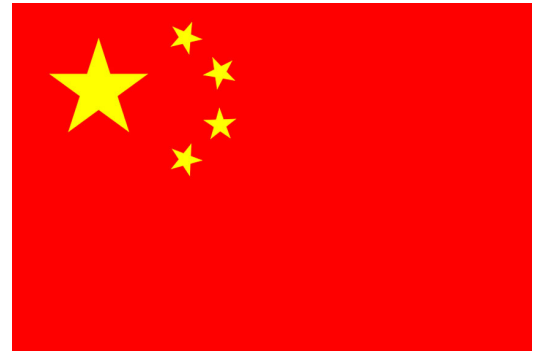
Drapeau de la Chine

De là haut, on voyait les rizières ; les champs dans lesquels on fait pousser le riz. Ils en mangent beaucoup ici.