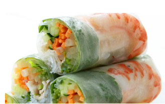
Rouleau de printemps

Je suis aussi allé à Pékin, la capitale de la Chine.