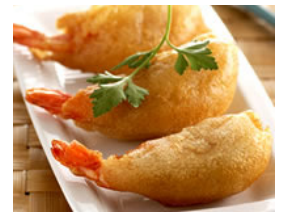
Beignets de crevette