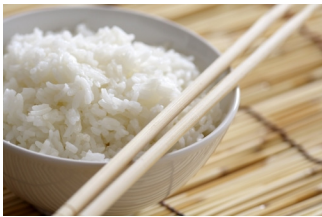
Bol de riz

D'ailleurs, ici aussi je mange bien : il y a des nems, des beignets de crevette, des rouleaux de printemps et des bols de riz. C'est très bon mais ce n'est pas facile de manger avec des baguettes. Hé oui, ici ils ne mangent pas avec une fourchette. Vous devriez essayer, c'est marrant !