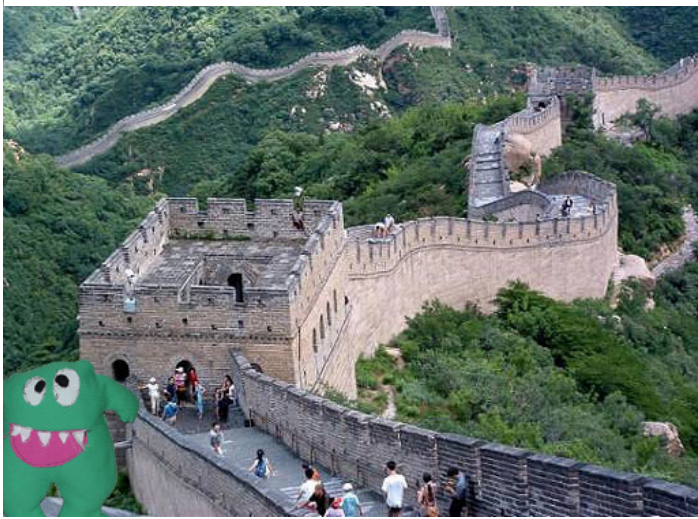
Grande muraille de Chine