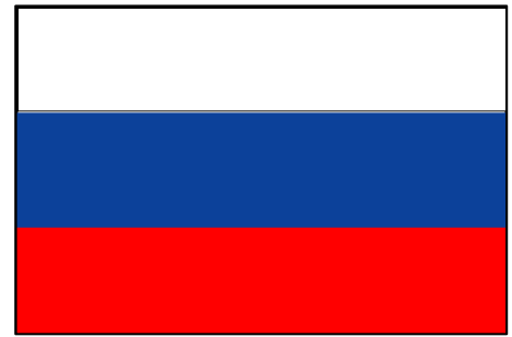
Drapeau de la Russie

Mon voyage continue et je commence à m'éloigner de la France. Je suis parti dans un très grand pays : LA RUSSIE . Ce pays est tellement grand, qu'il est sur 2 continents : en Europe et en Asie. Essayer de la trouver sur la carte ; c'est le plus grand pays du monde !