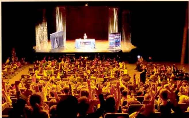
Vallauris ~ Novembre 2013