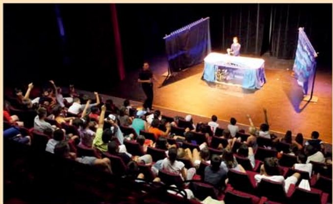
Nice ~ Juillet 2013

Le 07/11/13 Vallauris (06) 1 représentation, 525 enfants