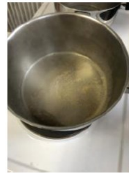
Vaporisation de l'eau salée

Vidéo: « C'est pas sorcier » sur l'extraction du sel de mer