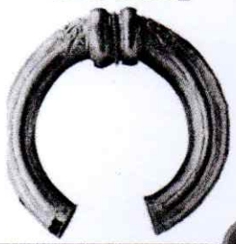
Torque en or, III e me-1 er s. av. J.-C.