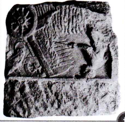
Moissonneuse, II e me s. av. J.-C.